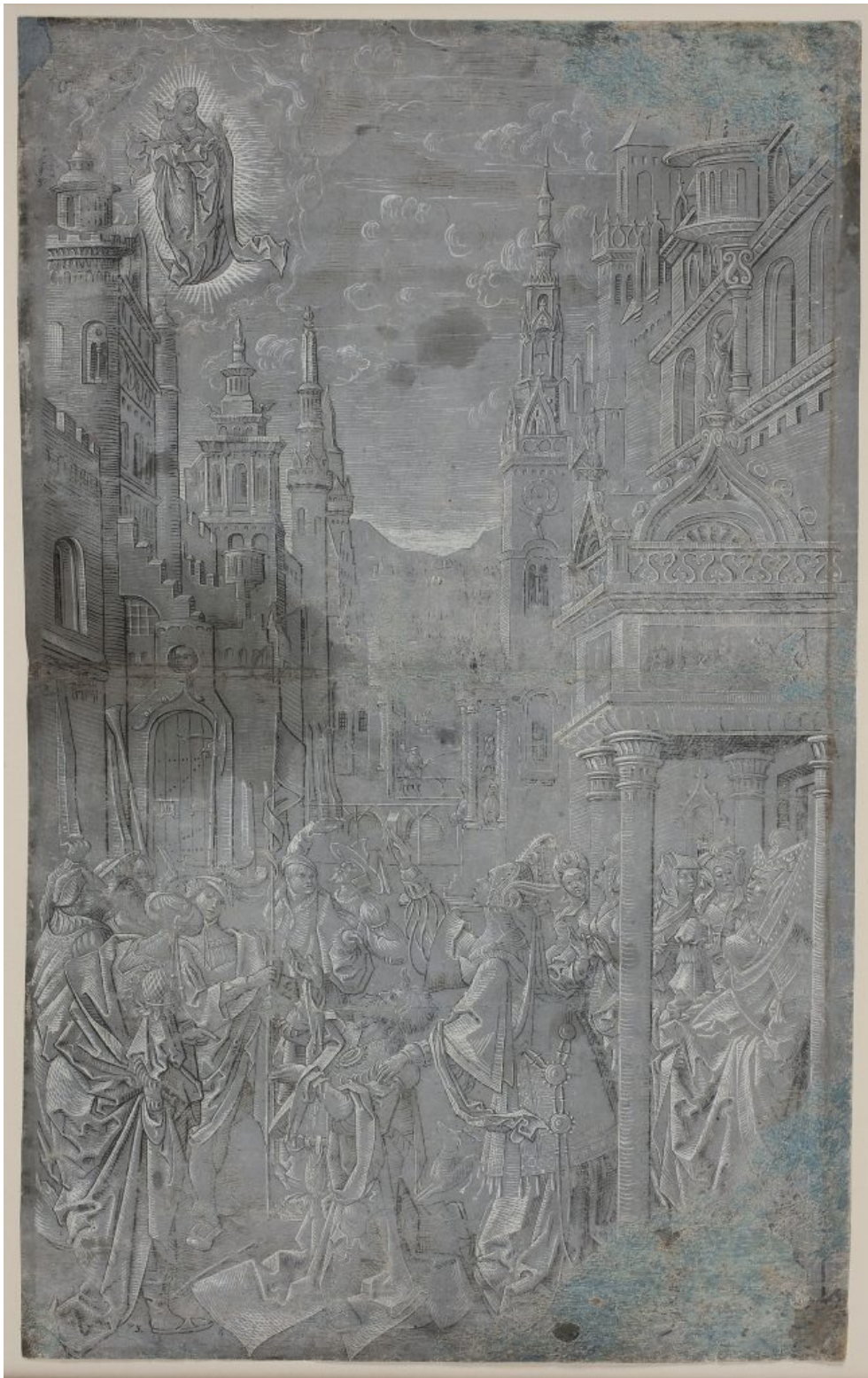
Abb. 11: Antwerpener Meister, Die Sibylle von Tibur weissagt Kaiser Augustus, um 1515/1520, Tempera auf Leinwand, 175.0 x 119.0 cm, Kunstsammlung der Akademie der bildenden Künste Wien.