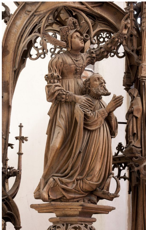
Abb. 5: Detail aus Abb. 1.

An Douvermans Retabel steht die Sibylle mit nach oben gerichtetem Blick und hochgestrecktem linken Arm und weist mit ausgestrecktem Zeigefinger auf die Jungfrau Maria mit dem Jesuskind; ihr Mund ist leicht geöffnet, die Lippen sind gespitzt, sie spricht (Abb. 5).