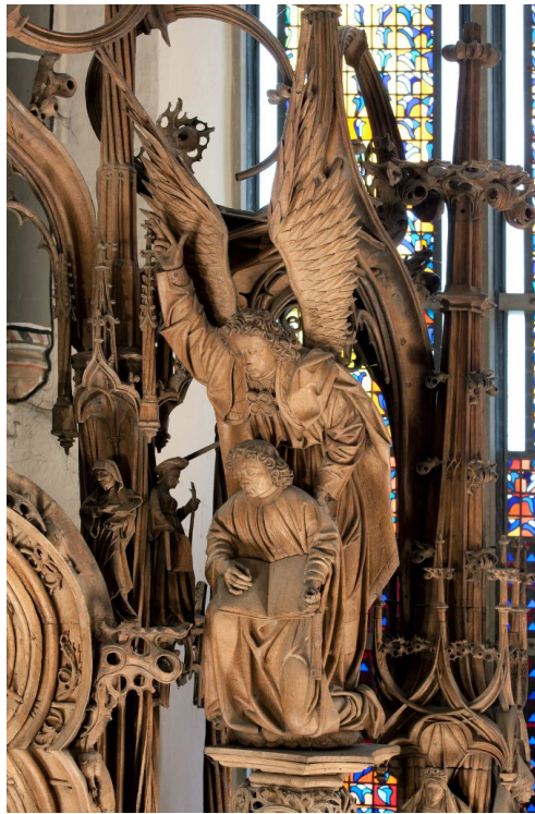
Abb. 6: Detail aus Abb. 1.

Es ist die Figur des Engels, der laut dem Buch der Offenbarung (Offb. 1) Johannes auf Patmos erscheint. Leicht nach vorn gebeugt weist er mit dem Segensgestus seiner rechten Hand auf die auf der Mondsichel stehende Gottesmutter hin, blickt dabei in Richtung Johannes und führt diesen mit der Linken in Richtung Marienerscheinung. Johannes kniet mit einem großen aufgeschlagenen Buch auf dem Schoß und schreibt seine Vision des apokalyptischen Weibes nieder (Offb. 12). Beide sind in faltenreichen, aber ansonsten schlichten Gewändern gekleidet.