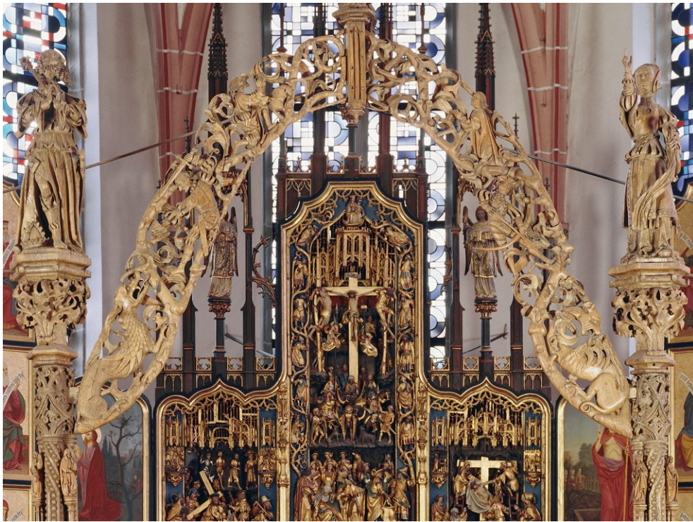
Abb. 14: Meister von Elsoo (zugeschr.), Lettnerbogen mit Sibylle und Augustus, 1. Hälfte 16. Jh. (vermutl. um 1520), Eichenholz, Pfarrkirche Siersdorf.

Es finden sich im für Douvermans Kalkarer Retabel prägenden Kontext demnach zum einen Darstellungen der ara-coeli -Sibylle mit Kopfschmuck-Kreationen wie enganliegenden Hauben mit herabfallenden Schleiern oder modischen Frisuren mit kostbaren Hauben, die deutlich als zeitgenössische Referenzen höfischer, ranghoher Gewandung anzusehen sind und Identifikationsmöglichkeiten bieten bzw. Modellhaftigkeit signalisieren können. Zum anderen markieren stilisierte Ohrflügel und/oder Federharnisch-Variationen als „Phantasiehelm[e]“ 41 mit antikisierenden Elementen die Sibylle gerade als antike Seherin. Ob es sich dabei tatsächlich um eine rein generische Antikenreferenz handelt, kann an dieser Stelle nicht geklärt werden. An der Douvermanschen Sibylle aber wird im Vergleich deutlich, dass der Bildschnitzer in Kalkar auf originelle Weise weitergeht.