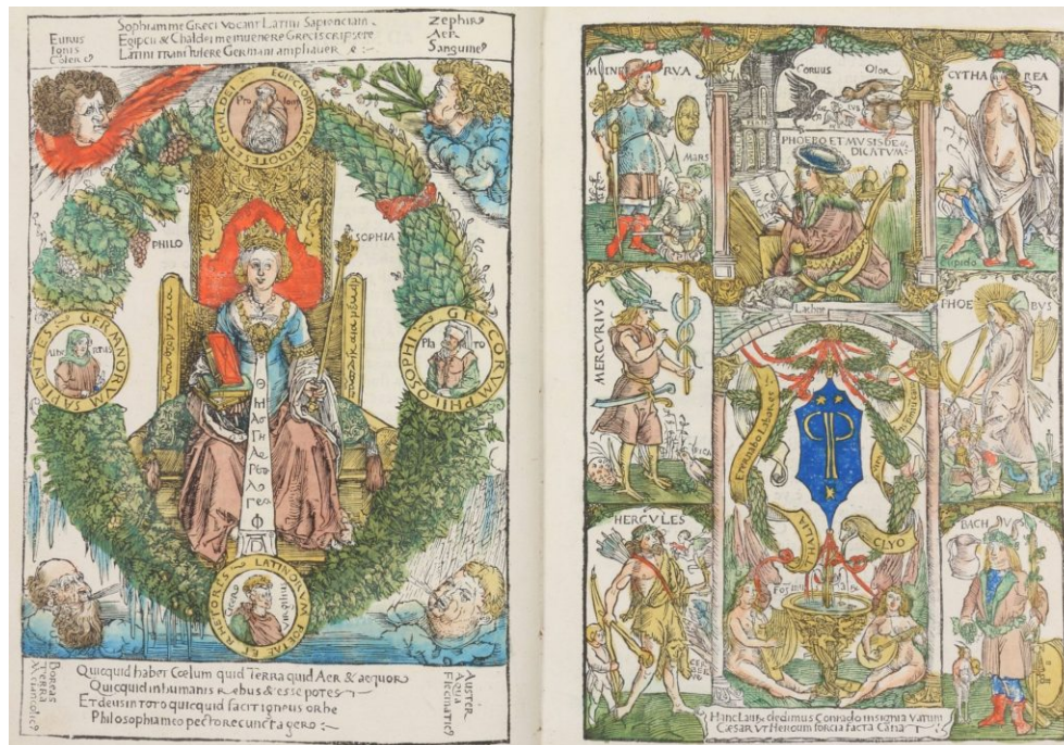
Abb. 15: Konrad Celtis, Amores, Nürnberg 1502, fol. a6v (nach Albrecht Dürer: Philosophia) und a7r (Meister der Celtis-Illustrationen: Celtis als Dichter im Kreis antiker Götter und Musen).

Dass Flügel Schwung und Leichtigkeit bedeuteten, die die Bewegung auf dem Weg zum Göttlichen ermöglichen, zeigen natürlich v. a. die Flügel der Engel als Himmelsboten. 42 Doch die Flügel am bzw. auf dem Kopf waren vor allem durch eine der prominentesten und im 16. Jahrhundert vielfach dargestellten und allegorisch aufgeladenen Figuren bekannt: Hermes/Merkur, den antiken Götterboten, Gott der Beredsamkeit, Verkünder von Ruhm und Frieden. 43 Sein geflügelter Helm (und oftmals auch seine geflügelten Schuhe) erlauben es ihm, als Bote zwischen dem himmlischen und irdischen Bereich unterwegs zu sein und zu kommunizieren – Botschaften der Götter an die Menschen zu überbringen, aber auch zwischen beiden zu vermitteln. Im Spätmittelalter wurde zudem ein Planet nach ihm benannt und zu seinen Planetenkindern gehörten nicht zuletzt Künstler, weshalb er auch sozusagen als Schutzpatron der Kreativen galt. 44 So ist Merkur beispielsweise im Autorenbild des Poeten und Poetologen Konrad Celtis in damals typischer Darstellungsmanier zu sehen (Abb. 15). 45