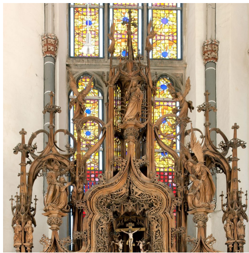
Abb. 4: Detail aus Abb. 1.

Verbreitung. 13 Unten rechts ist die Darstellung Christi im Tempel zu sehen, während der Simeon Maria offenbarte: „und auch deine Seele wird ein Schwert durchdringen“ (Lk 2, 34–35). 14 Darauf folgen im Uhrzeigersinn die Flucht nach Ägypten und die Szene von Jesus unter den Schriftgelehrten im Tempel, als Maria ihn in Jerusalem verloren glaubte; daran schließen die Begegnung mit Jesus auf dem Kreuzweg sowie seine Kreuzigung, Kreuzabnahme und Grablegung an. Umrankt werden die Szenen von der alttestamentlichen Wurzel Jesse (Jes. 11, 1) und ihren Trieben, die hier ins Eichenholz geschnitzt Gestalt angenommen haben. Sie wachsen ausgehend von der Figur des schlafenden Jesse in der Predella empor. In ihrem blattreichen Geäst klettern die genealogischen Vorfahren Christi bis hinauf zum Altargesprenge. Dort spitzt sich das hohe und schmale Retabel in drei Bögen zu (Abb. 4):