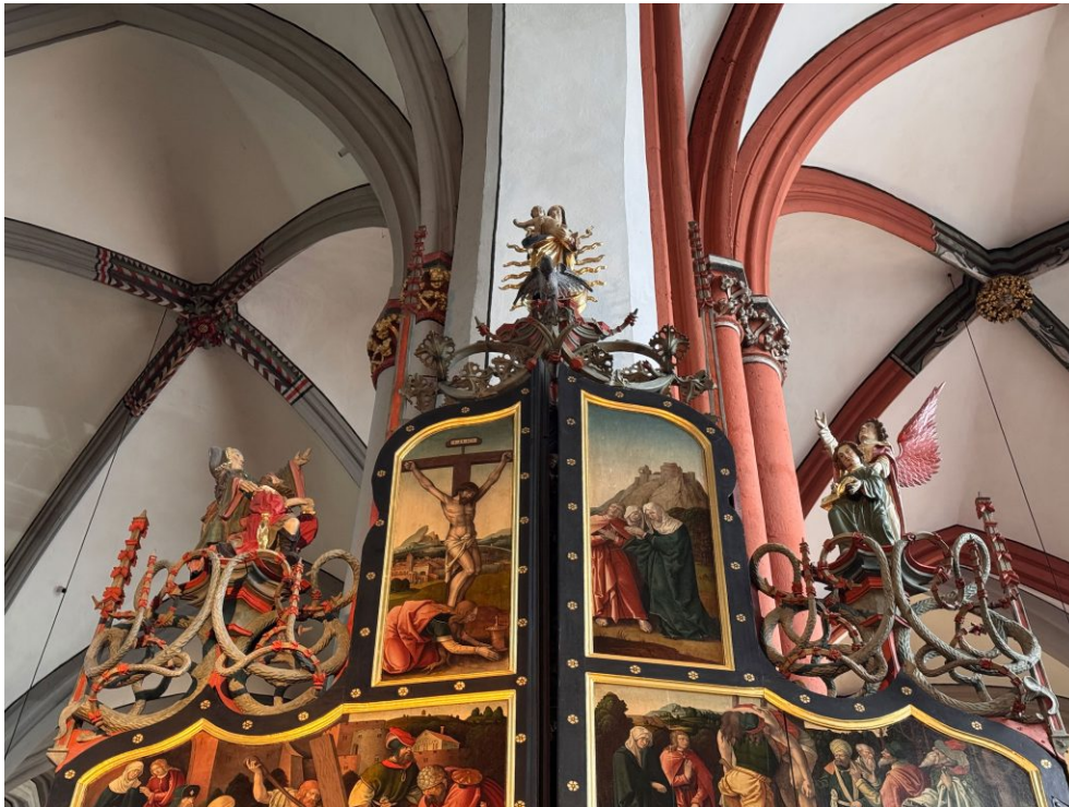
Abb. 17: Henrik Douverman (Konzeption und Predella), Arndt van Tricht, Henrik van Holt (Gespenge-Figuren, zugeschrieben), Marienaltar, 1545, Eichenholz, polychrom gefasst, St. Viktor, Xanten.

Goldrand. Zugespitzt gesagt, ist die Sibylle hier uninspiriert geblieben.