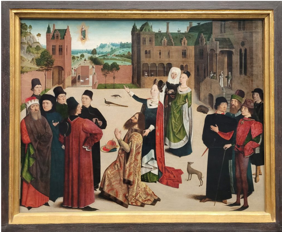
Abb. 9: Meister der Tiburtinischen Sibylle, Weissagung der Sibylle von Tibur, um 1480, Städelmuseum, Frankfurt.

Kontroverse um die Unbefleckte Empfängnis teilhatten, die Haltung von Papst Sixtus IV. unterstützten und hier im Bild vermutlich in der Gruppe der modisch gekleideten Männer des kaiserlichen Gefolges porträtiert sind. 33