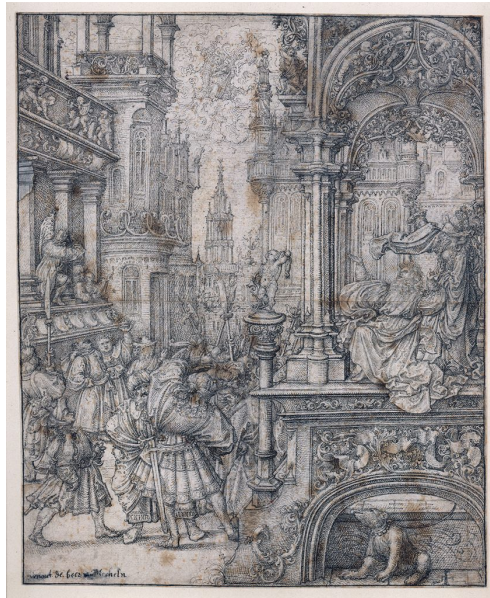
Abb. 10: Jan Gossaert, Kaiser Augustus und die Sibylle (von Tibur), Federzeichnung mit schwarzer Tinte, vor 1516, vermutlich 1503-1509, 338 x 274 mm, Berlin, Staatliche Museen, Kupferstichkabinett, inv. 15295.

Brüsseler Rathaus mit der Figur des Erzengels Michael auf dem Drachen (Offb. 12, 7) aufweist. 35 Die Sibylle ist derweil in einem aufgebauschten Kleid mit wehender Schärpe dargestellt und trägt einen raumgreifenden antikisierenden Helmbusch mit großen, aufgerollten Federn als Schmuck, der mit einem breiten Band ums Kinn gebunden ist. Die Sibylle wird hier somit deutlich als antik-pagane Figur, als Weissagerin vorchristlicher Zeit markiert, die zugleich in einem auf verschiedene Zeitebenen rekurrierenden architektonischen Setting erscheint.