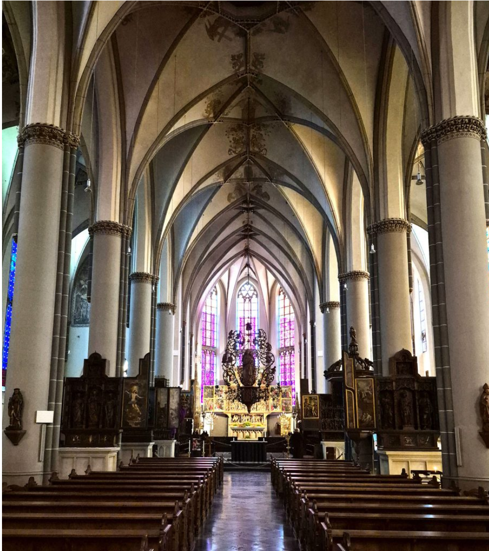
Abb. 2: Carl Friedrich Brandt, Blick in den Nordchor von St. Nicolai in Kalkar mit dem Sieben-Schmerzen-Altar, Fotografie, 1868.