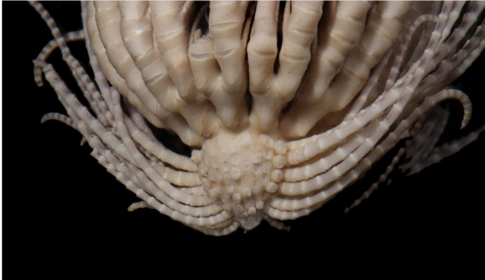
Erdbeerefederstern. Promachocrinus fragarius .

Gerade die Entdeckung und das Entstehen von Neuem sind es, die Welt und Natur zu etwas Unerschöpflichem und Dynamischem machen. Die Natur ist mehr als nur eine – wenn auch 37 Bücher umfassende – Enzyklopädie.