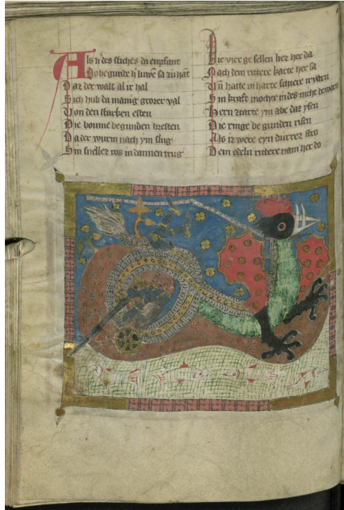
Abb. 2: Wirnt von Gravenberc, Wigalois . fol. 53v.

prächtigen Pfauenfedern ( schæniu vetiche ). Die Erwähnung von Pfauenfedern hat offensichtlich auch dazu geführt, dass der Drache in einem besonders bekannten illustrierten Codex des Wigalois wie zu einem Pfau mit Krallen und Zähnen transformiert scheint: